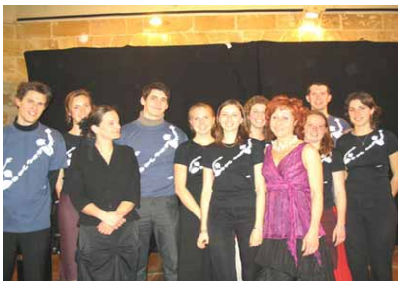
Les membres de Déka-Ewé France autour des deux musiciennes