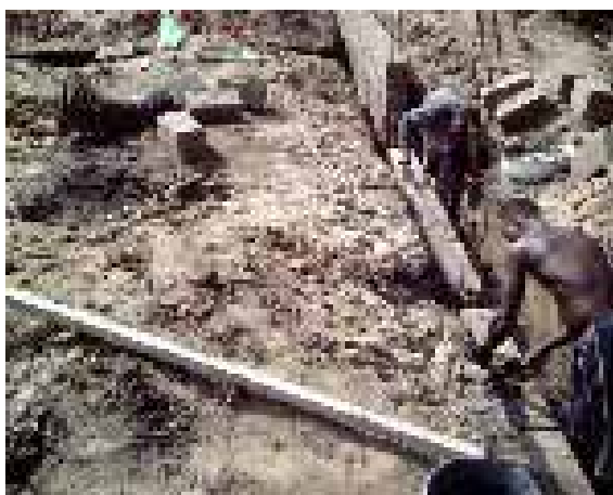
L'élévation des murs de l'école de Bolou en juillet 2005