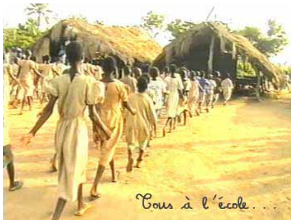
L'école actuelle de Bolou

En plus de répondre à un besoin, il est important que la demande émane de la population locale. Il ne s'agit pas de pointer une zone géographique, de rechercher les statistiques et de se dire que ce village aurait besoin d'aide. Le fait que les populations locales soient à l'origine du projet ou en aient fait la demande garantit sa pérennité (nous reviendrons sur ce thème plus tard). Si le projet répond à leurs attentes, elles sauront comment utiliser et gérer ce nouvel outil et s'attacheront à le préserver. Ainsi, notre projet « Une école pour Bolou » est né de la demande des instituteurs du village, en concertation avec le comité des parents d'élèves, le comité de développement et le chef du village. Depuis le début du projet, tous sont impliqués dans sa réalisation, ils attendent avec impatience le début des travaux. Tout ceci nous porte à penser qu'une fois les travaux finis, ils pourront réellement bénéficier de cette infrastructure et s'attacheront à la préserver.